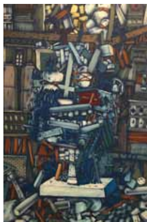
Busta airbrush a akryl na plátně, 110 x 73 cm, 2017