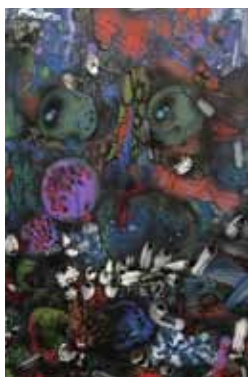
Džungle airbrush a akryl na papíře 43 x 29 cm, 2017