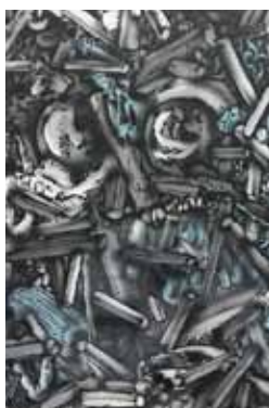
Brown field airbrush a akryl na papíře 43 x 29 cm, 2017