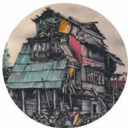
Chatrč airbrush a akryl na plátně ø 53 cm, 2017