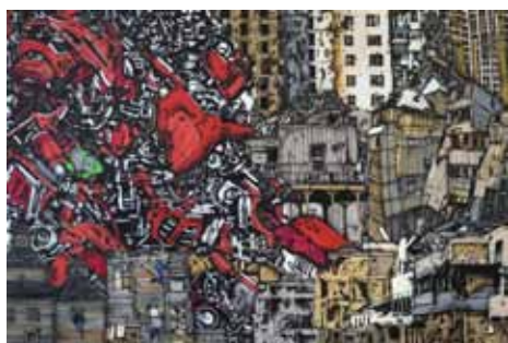
Motortown 1 airbrush a akryl na plátně 100 x 150 cm, 2017