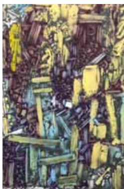
Opuštěná stavba airbrush a akryl na papíře 43 x 29 cm, 2017