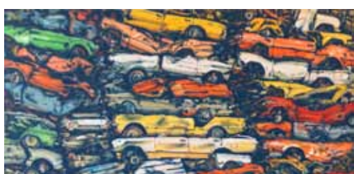
Dodge airbrush a akryl na plátně 63 x 130 cm, 2016