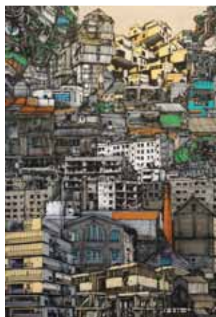
Motortown 2 airbrush a akryl na plátně 150 x 100 cm, 2017