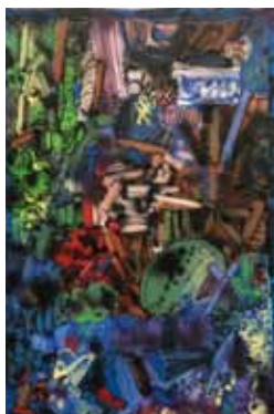
Zahrada airbrush a akryl na papíře 43 x 29 cm, 2017