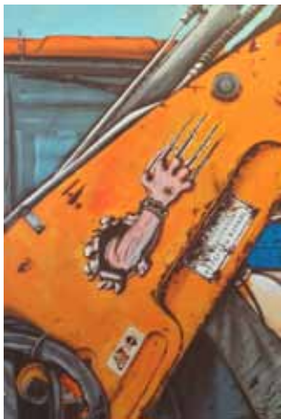
Bagr airbrush a akryl na plátně 185 x 125 cm, 2016