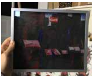
TRON 2 akryl na plátně 24 x 30 cm, 2010