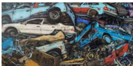
DK DM airbrush a akryl na plátně 63 x 130 cm, 2016