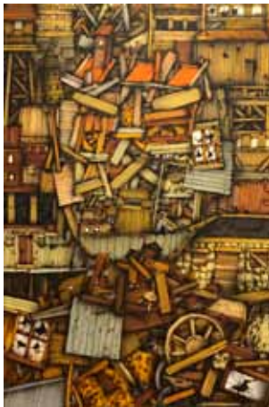
Portrét airbrush a akryl na plátně, 110 x 73 cm, 2017