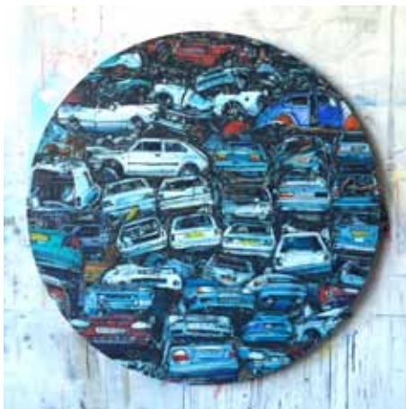
Megane airbrush a akryl na plátně ø 120 cm, 2017