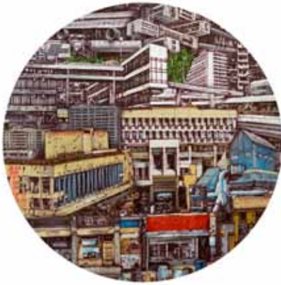
Betonová džungle airbrush a akryl na plátně ø 120 cm, 2017