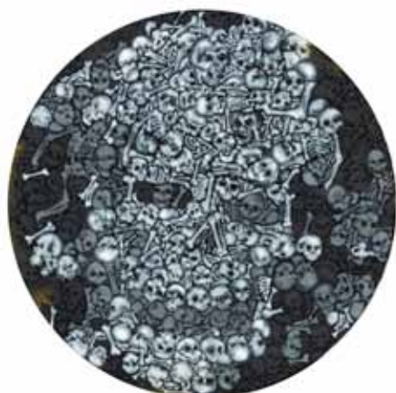
Kostnice airbrush a akryl na plátně ø 53 cm, 2016