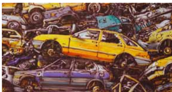
Pocta sierralistům airbrush a akryl na plátně 42 x 80 cm, 2017