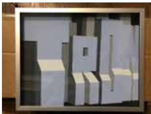
TRON 1 akryl na plátně 24 x 30 cm, 2010