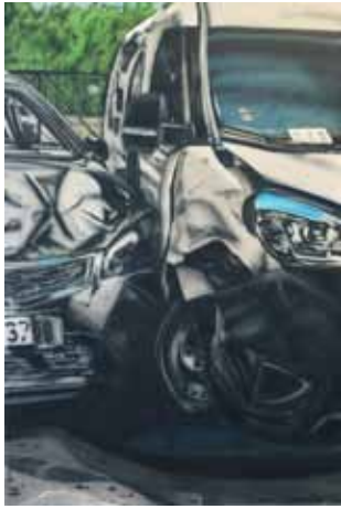
Bouračka airbrush a akryl na plátně 185 x 125 cm, 2016