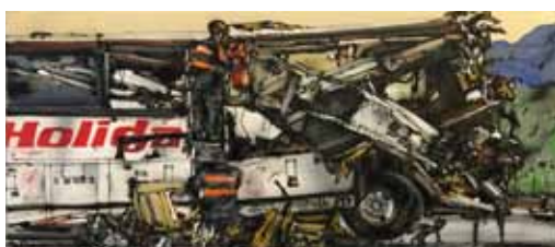
Hurá na prázdniny airbrush a akryl na plátně 27 x 61 cm, 2017